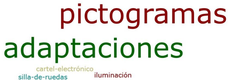
Figura 4: Distribución (nubes de palabras claves por medio del programa Atlas Ti 8) de los facilitadores que necesita la PCD.

En la figura 4 se muestran los facilitadores que necesita la PCD y en la figura 5 la eliminación de barreras que necesita para su acceso.