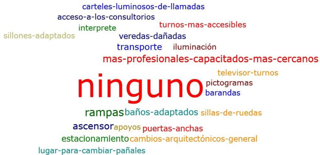
Figura 6: Distribución a través del programa Atlas Ti8 en nubes de palabras de los apoyos o facilitadores y barreras para las PCD al acceder a la institución odontológica

En la misma (Fig. 6) se puede observar a nivel general que tipo de apoyos, facilitadores necesitaría para poder acceder a la institución odontológica. El 74,0% (n=303) han respondido que no necesitan ningún facilitador u apoyos para el acceso a la institución odontológica.