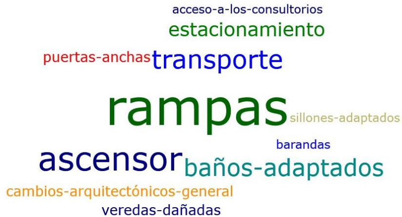
Figura 9: Distribución a través del programa Atlas Ti8 en nubes de palabras de las barreras que impiden acceder a la institución odontológica

En la figura 9 se muestran en un análisis con Atlas Ti8 en una distribución en nubes de palabras la falta de apoyos y facilitadores, ausencia que opera como barrera en el acceso a la institución odontológica. La primera frecuencia es la falta de rampas (FA=37); la segunda es la falta de ascensores (FA=21); la tercera es la falta de transporte (FA=14); le sigue la falta de baños adaptados (FA=12); la falta de estacionamiento (FA=8); la falta de veredas sanas, cambios arquitectónicos en general y falta de puertas anchas (FA=3 respectivamente); falta de acceso a los consultorios, barandas y sillones adaptados (FA=1 respectivamente).