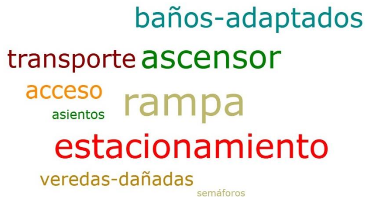
Figura 1: Distribución (nubes de palabras claves por medio del programa Atlas Ti 8) de los apoyos las que necesita la PCD y que su ausencia actúan como BARRERAS.

En la tabla 3 se puede observar la frecuencia de las palabras claves de apoyos, facilitadores y barreras. Como puede observarse en los apoyos la palabra que más frecuencia tiene es la “capacitación”, esto refiere a la capacitación de los profesionales o de las asistentes con respecto al trato hacia las PCD o en los conocimientos sobre la condición