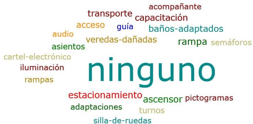
Figura 2: Distribución (nubes de palabras claves por medio del programa Atlas Ti 8) de los apoyos, facilitadores o eliminación de barreras que necesita la PCD.

En la figura 2 se muestra a modo general las respuestas que han dado.