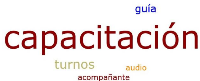
Figura 3: Distribución (nubes de palabras claves por medio del programa Atlas Ti 8) de los apoyos que necesita la PCD.

En la figura 3 se muestra los apoyos que las PCD necesitan para poder acceder a la institución médica.