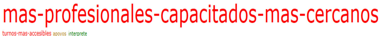
Figura 7: Distribución a través del programa Atlas Ti8 en máquina de escribir de los apoyos que necesitaría para acceder a la institución odontológica

En la misma (Fig. 6) se puede observar a nivel general que tipo de apoyos, facilitadores necesitaría para poder acceder a la institución odontológica. El 74,0% (n=303) han respondido que no necesitan ningún facilitador u apoyos para el acceso a la institución odontológica.