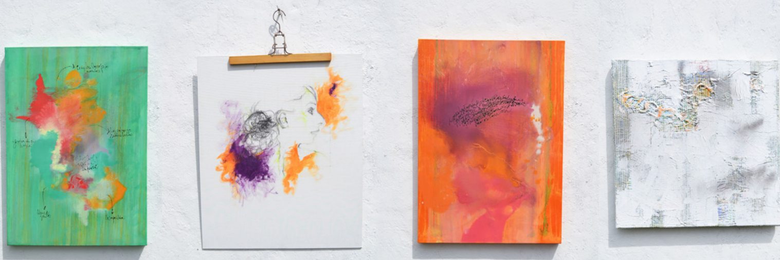
+ Algunas obras de Vanina

en ese lapso. Los tiempos son otros, como ya dije, y es todo un desafío, muy interesante.