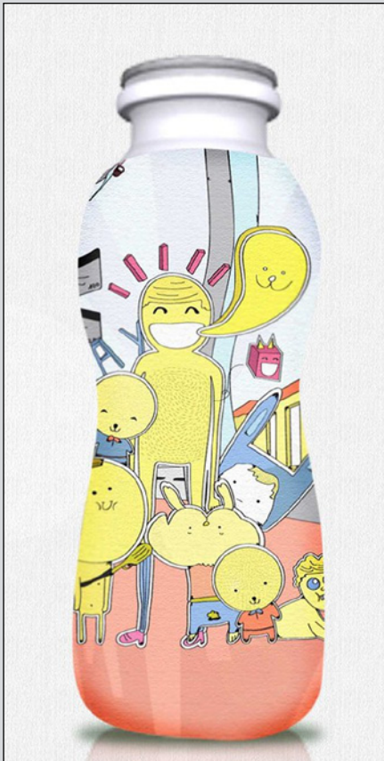
+ por Pablo Piazza Uno de los ganadores del concurso "expresá tu ser"