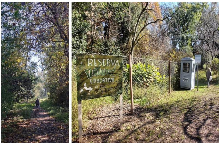
Figura 4: Reserva Natural Educativa de Ingeniero Maschwitz