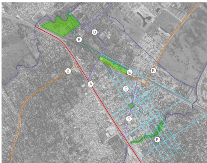
Figura 6: Tipos de vialidades de Ingeniero Maschwitz

A) Vialidad primaria: Autopista Panamericana-Ruta Nacional 9; B) vialidad secundaria: Ruta provincial 26; C) Vialidad terciaria intermedia; D) Vialidad terciaria gris; E) vialidad terciaria verde. Elaboración propia.