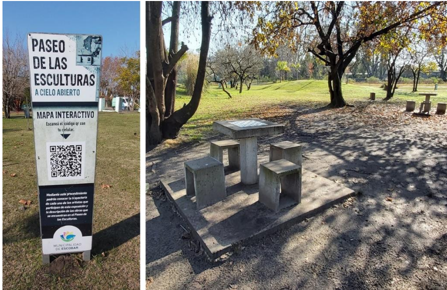
Figura 3: Parque Papa Francisco

La plaza Emilio Mitre categoriza como muy bueno, seguido por el Parque Papa Francisco que califica como avanzado. Los Tramos del Arroyo Garín y la Reserva Natural Educativa de Ing. Maschwitz, ambos califican como de media calidad (Figuras 3 y 4).