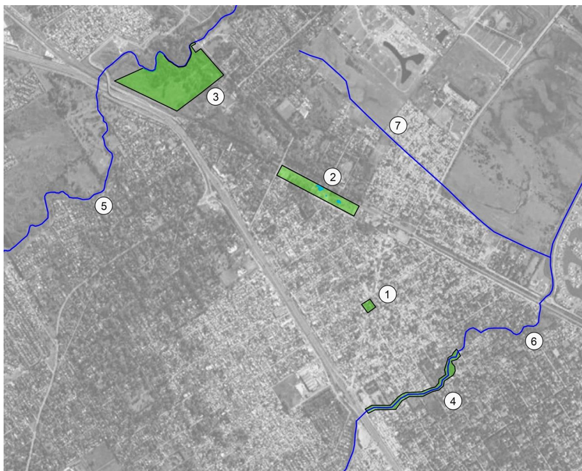
Figura 1: Localización de los cuatro espacios verdes analizados en Ing. Maschwitz

1) Plaza Emilio Mitre, 2) Parque Papa Francisco, 3) Reserva Natural Educativa de Ingeniero Maschwitz, 4) tramos del Arroyo Garín entre la calle Fernández y Santa Fe, 5) Arroyo Escobar, 6) Arroyo Garín y 7) Arroyo Alberti. Elaboración propia.