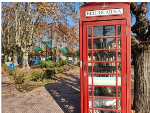
Figura 2: Plaza Emilio Mitre

La Plaza Emilio Mitre presenta una muy buena calidad de espacio público. Se caracteriza por contar con una vegetación diversa, buenos solados y accesibilidad, juegos infantiles, cartelera alusiva y una biblioteca (Figura 2).